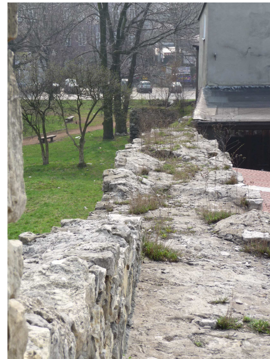
WIDOK NA KORONĘ MURÓW