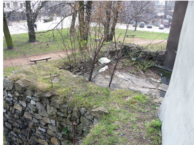
WIDOK NA KORONĘ BASZTY II