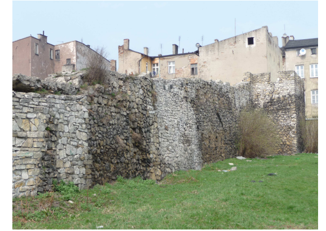
WIDOK NA MURY