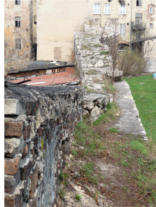
WIDOK NA KORONĘ MURÓW