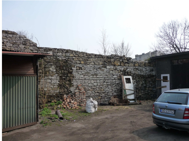
WIDOK NA MURY OD STRONY STAREGO MIASTA