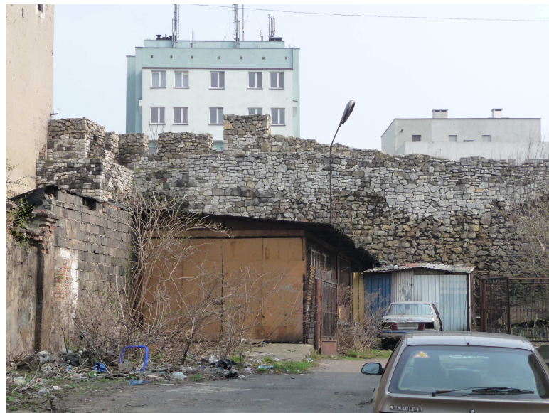
WIDOK NA I BASZTĘ OD STRONY STAREGO MIASTA