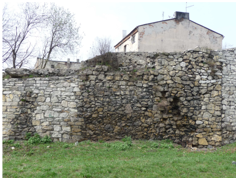
WIDOK NA PRZEMUROWANIA WSPÓŁCZESNE GRANICA STAREGO I NOWEGO MURU