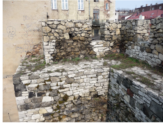
WIDOK NA KORONĘ BASZTY I