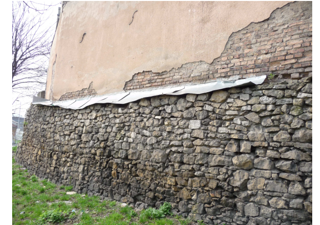
WIDOK NA TYMCZASOWĄ OBR. BLACHARSKĄ