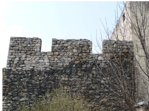
WIDOK NA FRONT BASZTY I