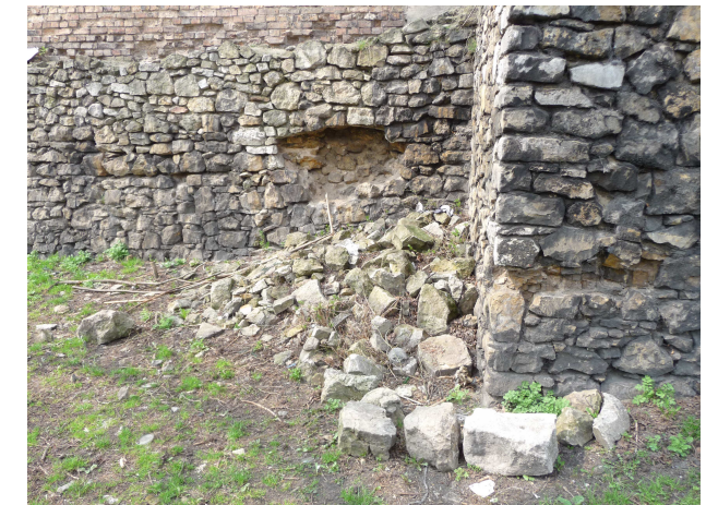
UBYTKI W MURZE SEKTOR 22